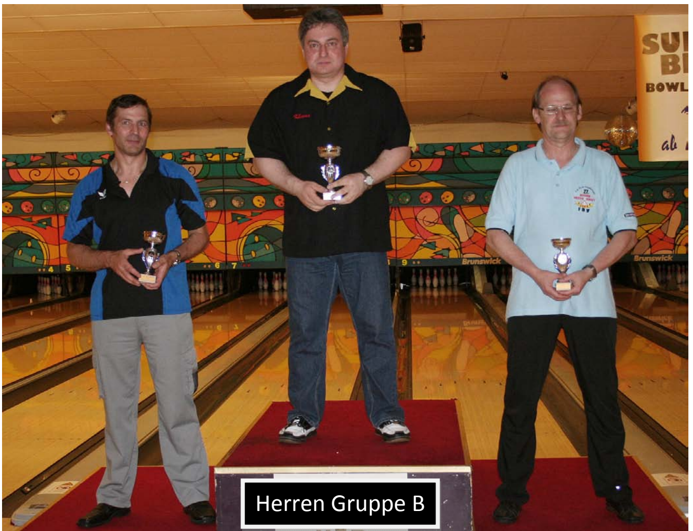
Herren Gruppe B